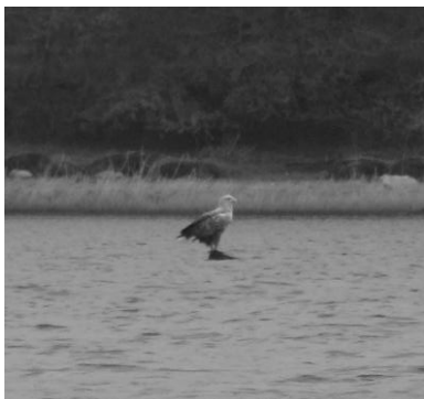
Havørn ved Jungshoved

På nord- og østsiden af Jungshoved er der mange store sten, så der blev holdt god afstand til kysten. Dog var vi tæt under land en enkelt gang, da vi opdagede en havørn, siddende på en sten i vandet.